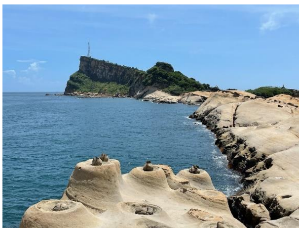
圖 1 台灣地景保育網任選一張地景的照片或自行拍攝或選用照片(請務必註明出處)