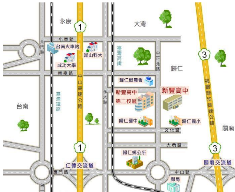
▲ 圖 1 路線圖